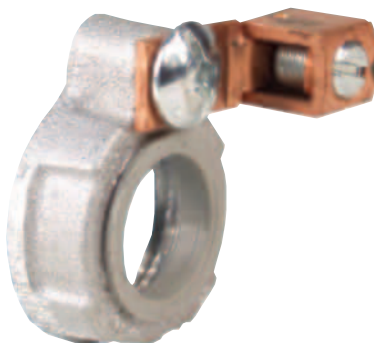
CI2604 / CI2632