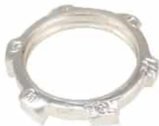
CI1704-AL / CI1732-AL