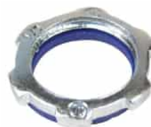
CI1704-SL / CI1732-SL