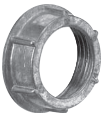
BU 201 / BU 210