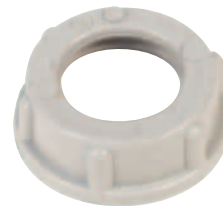
2704 / CI2748