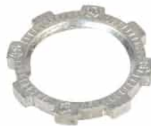
LN 201 / LN 210