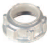
CI2404 / CI2448