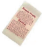
Repair Patch Patch de réparation Parche de reparación