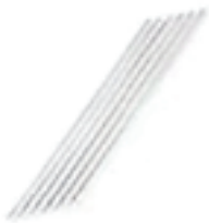
Plastic Bracket Support en plastique Soporte de plástico