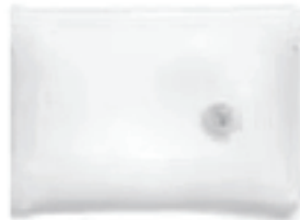
Cussion Coussin Cojín