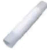
Drain Pipe Tuyau d'évacuation Tubería de desagüe