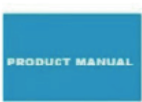
User Manual Manuel d'utilisation Manual de usuario