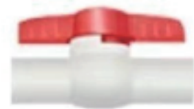
Faucet Robinet Grifo