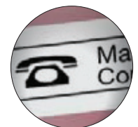
Faites preuve de créativité grâce aux étiquettes personnalisées avec cadres et symboles