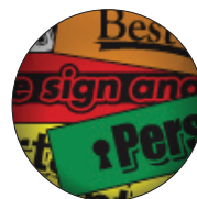
Collection d'étiquettes intégrée : plus de 50 étiquettes préconçues