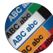
Organisez et identifiez. Étiquettes multicolores pour faciliter l'identification