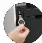
Impression depuis et numérisation vers l'interface USB directe