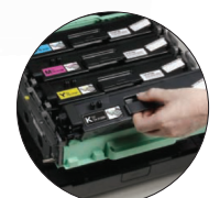
Cartouches de remplacement à haut rendement disponibles