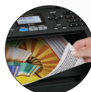
Impression recto verso automatique pour économiser de l'argent et du papier