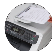
Économisez du temps grâce au chargeur automatique de documents fort pratique