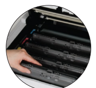
Chargement par le haut pour facilement installer et remplacer les cartouches de toner