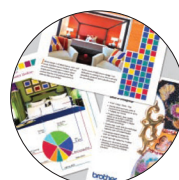
Résultats aux couleurs éclatantes jusqu'à 600 X 2400 ppp