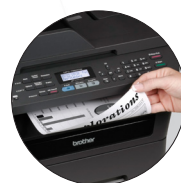
Impression recto verso automatique