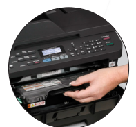
Cartouches de toner de remplacement à haut rendement disponibles